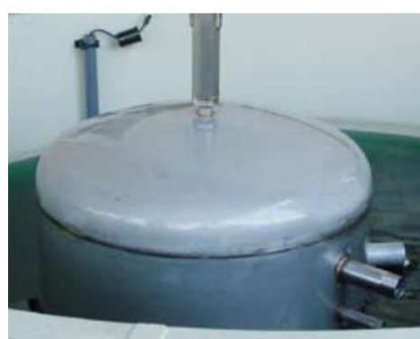
Der Speicher wird in Säure gebeizt.

>> Das Beizen schliesslich schützt den Edelstahl-Speicher vor äusseren Einflüssen. Der Speicher wird während bis zu zweiinhalb Stunden in der Beizsäure eingelegt. Dadurch wird die Oberfläche „passiviert“. Beim Beizen gelten strenge Sicherheitsvorkehrungen. In einem mehrstufigen Prozess wird der Speicher von allen Säureresten befreit. Unsere Beizauflage erfüllt höchste Umweltstandards.