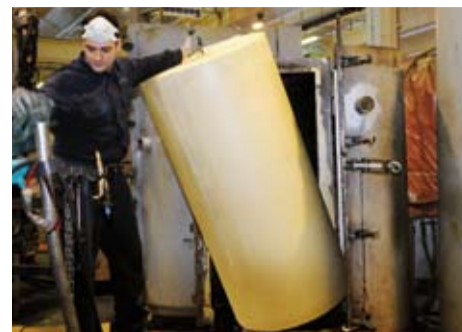
Der geschäumte Speicher.

>> Um den Speicher zu isolieren, wird er geschäumt. Dazu kommt der Speicher in eine Form, wo er mit PUR-Schaum ausgeschäumt wird.