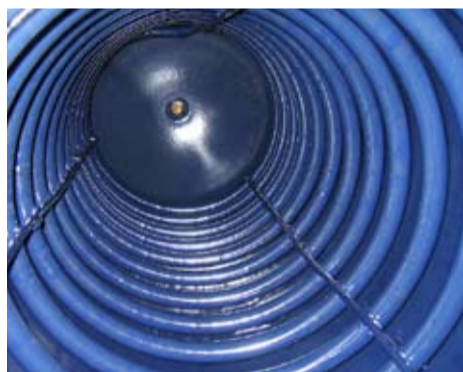
Die Emailierung für die Aufbereitung von Trinkwasser.

>> Der äussere Grundierungsanstrich sorgt dafür, dass der Speicher nicht korrodiert.