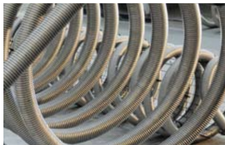
Das SPIRA®-Rohr. Dank der Rippenstruktur lässt sich die Heizoberfläche vervierfachen.

>> Das Rohr für den SPIRA®-Speicher wird zunächst exakt zugeschnitten und anschliessend auf einen speziell angefertigten Korb gewickelt. Danach werden die Anschlüsse verschweisst und das Produkt wird unter Druck geprüft.