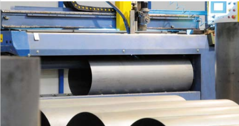
Das aufgerollte Blech wird mit dem Roboter längs verschweisst.

Nächste Station für den werdenden Speicher ist der Schweissroboter. Hier wird das aufgerollte Blech längs verschweisst, präzise und vollautomatisch. Menschliche Kontrolle aber muss sein, um höchste Qualität zu garantieren. ECOTEC-Angestellte überprüfen deshalb jede einzelne Schweissnaht.