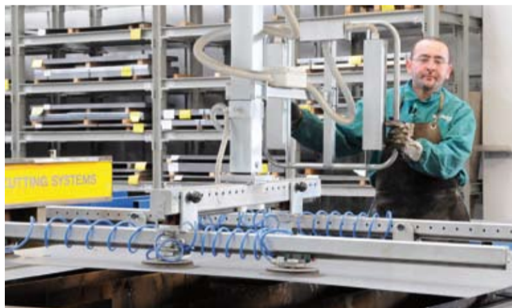
Positionieren der Blechtafeln auf der Plasmaschneidmaschine.

Ein Produktionsbetrieb in Domegliara, am Ufer des Flusses Adige, keine 20 Kilometer von Verona entfernt: Hier stellen die 45 Angestellten der ECOTEC die innovativen Speichersysteme her. Seit drei Jahren ist die ECOTEC ein Tochterunternehmen der FRIAP Holding AG. Das Werk liefert Speicher an FEURON, FRIAP, SCHRAG und Drittkunden. Die Produktion in Domegliara erfüllt höchste Standards – es ist ein Zusammenspiel von vollautomatischer Fertigung und Feinjustierung von Hand.