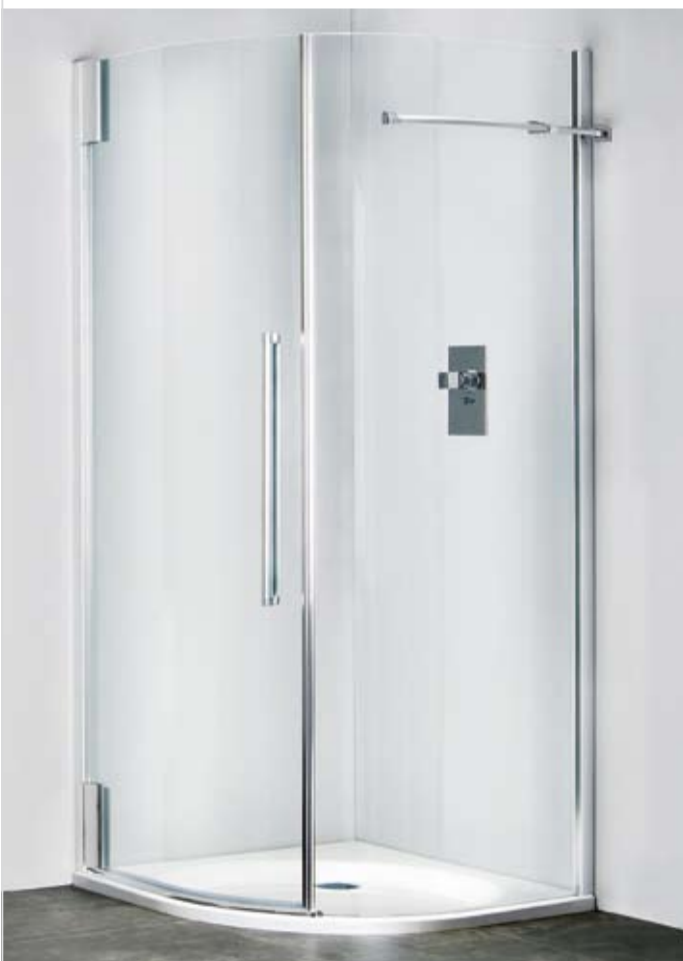
Die „princess 4000“ | Rundkabine.

Elegant, komfortabel und praktisch: Die neue duka-Duschtrennwand „princess 4000“ wird Sie und Ihre Kunden begeistern.