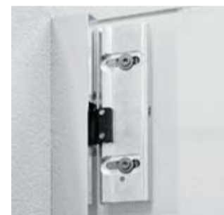
Technik vom feinsten: Der Hebe- und Senkmechanismus.

Bei all dem kommt auch die Technik nicht zu kurz. Die „princess 4000“ ist unverwundlich – dank Sicherheits-Echtglas (6 oder 8 mm) und einem Profildesign mit Wandstärken bis 5 mm. Beim Reinigen lässt sich Zeit sparen, weil sich auf der Innenseite nur Glasflächen befinden. Möglich machen es die Scharniere mit der duka-Klebetekologie. Diese lässt eine Verstellung des Glases um bis zu 25 mm zu – bei unveränderter Profilsthetik. Wie alle duka-Produkte ist die „princess 4000“ einfach zu montieren und bietet viele