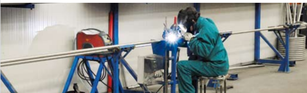
Zusammenschweißen der Rohrstangen.

>> Für den Integral-Wassererwärmer wird ein separater Speicher hergestellt, welcher danach in einen Kombispeicher eingebaut wird. Dieser wird unter Druck geprüft und anschliessend gebeizt.