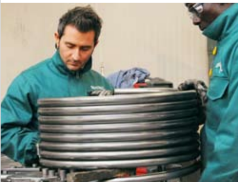
Verarbeiten des Glatrohrwärmetauschers.

>> Für den Glatrohr-Wärmetauscher werden mehrere Rohre zu einer langen Rohrstange (Standard: 18 Meter) zusammengeschweisst. Danach wird die Stange aufgewickelt und versteift. Zum Schluss erfolgt die Druckprüfung.