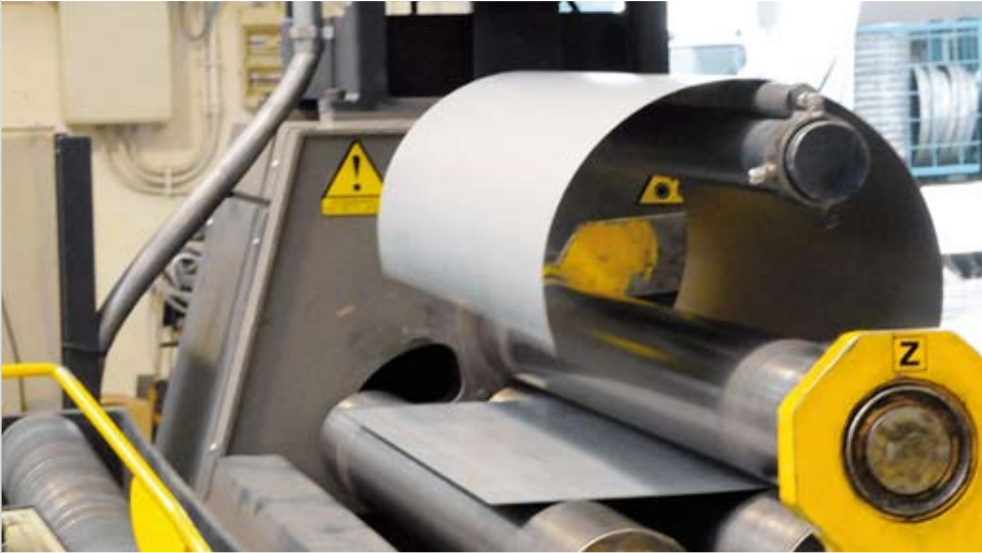
Die Biegemaschine rollt die Platte zu einem Mantel auf.

Ist die Grundplatte für den Speicher zugeschnitten, so gelangt sie zur Biegemaschine. Diese rollt die Platte zu einem Mantel auf – auch dies auf den Millimeter genau. Dies ist entscheidend für die folgenden Produktionsschritte. Die Biegemaschine kann kleinste und grösste Platten aufrollen – der kleinstmögliche Mantel hat einen Durchmesser von 230 Millimetern.