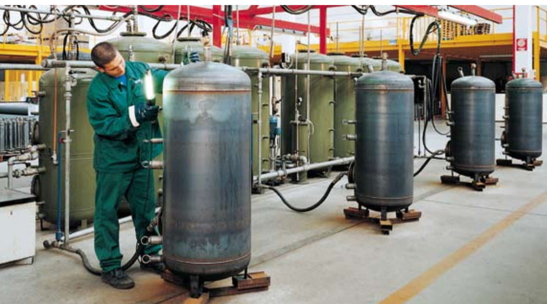
Der verschweisste Speicher wird unter Wasserdruck mit Licht sichtgeprüft.

>> Edelstahl und C-Stahl werden in getrennten Räumen verarbeitet, damit die Qualität gewahrt bleibt. Um Korrosion zu verhindern, werden die Metallteile passiviert. Konkret werden die metallischen Oberflächen mit einer Schutzschicht überzogen.