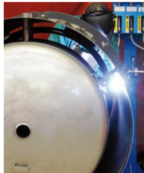
Einschweissen des Integral-Wassererwärmers.