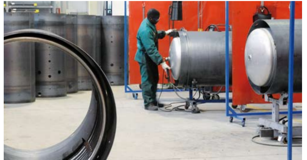
Schweiss-Montage-Stationen. Hier werden die Speicher zusammengebaut.

Sind die inneren Komponenten fertig gestellt, folgt die Montage, also das Einschweissen in den Speicher. Dafür stehen mehrere Schweiss-Montage-Stationen bereit. Dieser Produktionsschritt ist wahre Handarbeit. So können alle Kundenwünsche erfüllt werden. Je nach Speicherprodukt kann dieser Arbeitsschritt bis zu drei Stunden dauern.