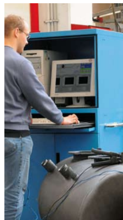
Speicher auf dem Prüfstand.

Der Speicher wird zum Schluss auf Herz und Nieren geprüft. Eine Fehlstrommessung zum Beispiel gibt Auskunft über die Qualität der Emailierung. Es folgen kleine Endmontagen, bis schlussendlich der Speicher ausgeliefert wird. Hochwertige Materialien und sorgfältige Verarbeitung machen die Speicher langlebig – dafür steht ECOTEC mit einer umfassenden Qualitätsgarantie ein.