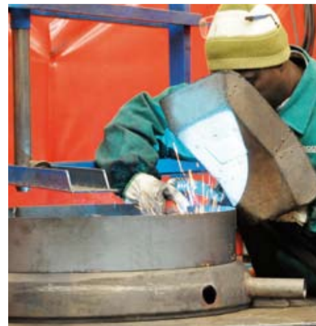
Vorbereitung der Speicherböden.