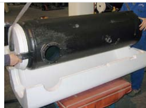
Der Speicher wird in die EPS-Isolation gehoben.

>> Emailierte Wassererwärmer werden mit EPS-Isolationen gedämmt. Die Speicher werden passgenau und eng anliegend isoliert. So entsteht eine Dämmung ohne Verlust an Energie. Die EPS-Isolation ist vollständig recycelbar und schont somit die Umwelt.