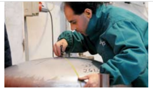
Ausmessen vom Kesselboden für die Herstellung vom Integral-Wassererwärmer.

>> Für den Integral-Wassererwärmer wird ein separater Speicher hergestellt, welcher danach in einen Kombispeicher eingebaut wird. Dieser wird unter Druck geprüft und anschliessend gebeizt.