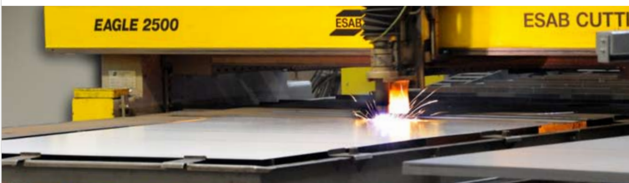
Die computergesteuerte Plasmaschneidmaschine.