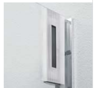
Die duka-Klebetekologie erleichtert das Putzen der Innenseiten.

Verstellmöglichkeiten. Ein Beispiel für den Praktiker: Schwimmende, verstellbare Stufenmagnete kompensieren leichte, montagebedingte Mass-Abweichungen.