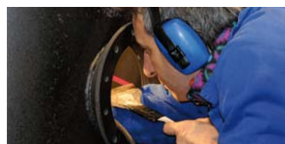
Prüfung der Emailierung.