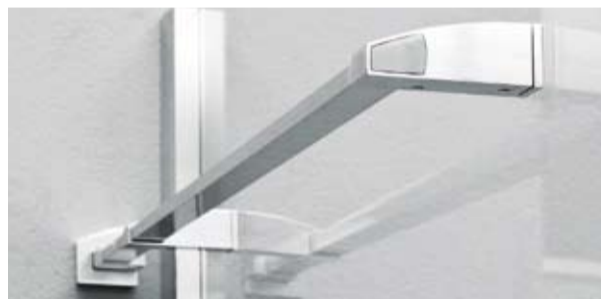
Stabilisierungsstütze und Handtuchhalter in einem.

S chönheit beginnt im Detail. Das sieht man an den edlen Scharnieren dieser Duschtrennwand. Was schön ist, darf auch praktisch sein: Der Einstieg besticht durch durchdachtes Design, die Flügeltüren schwingen weich nach aussen und bieten Komfort beim Ein- und Aussteigen. Die „princess 4000“ erfreut das Auge. Deshalb haben wir auch bei der Stabilisierungsstütze am Seitenteil an clevere Ästhetik gedacht: Die Stütze dient gleichzeitig als Handtuchhalter.