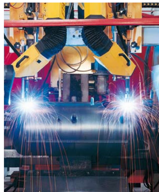
Verschweissen der Speicher-Böden.