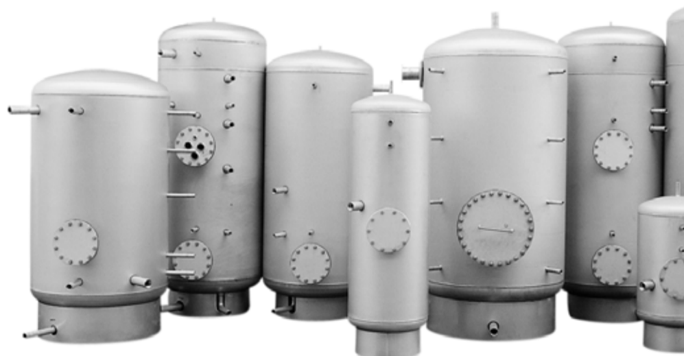
Auszug aus dem ECOTEC-Speichersortiment.