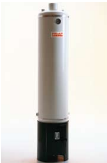
Badeofen-Wassererwärmer 100 Liter

Wassererwärmer als Komponenten zur FRIAP Solarkompaktanlage. Kann vorerst als elektrischer Stand-Wassererwärmer betrieben und später mit den Solarkomponenten ergänzt werden.