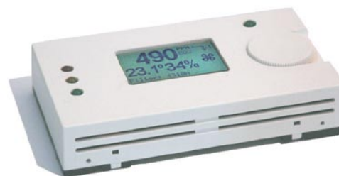
Air Intelligence - Raumbedienteil für Recovery Comfort 400 - CO 2 gesteuert, mit LCD Display.