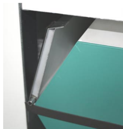
Bypassklappe beim Verschließen des Wärmetauschers

Alle Anschlüsse sind steckerfertig vorkonfektioniert. Anschliessbar sind bis zu 4 verschiedene Bedienteile, Vorheizregister & der SCHRAG-Safety-Manager