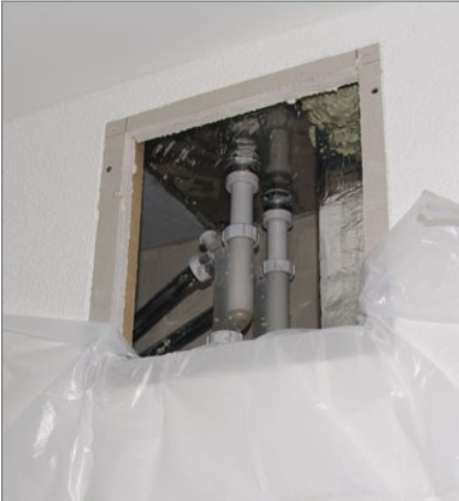
1. Wand schützen, Sifon abschrauben