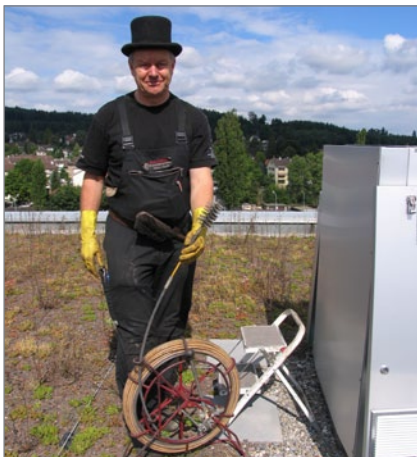
11. Mechanische Reinigung des Wärmetauschers