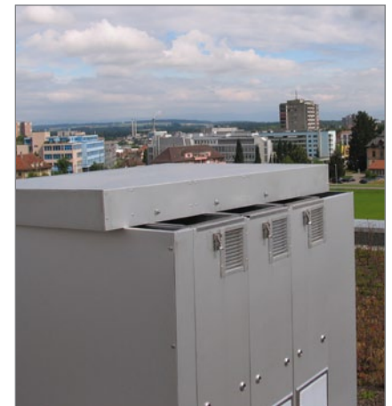
5. Entfernen der Abdeckung