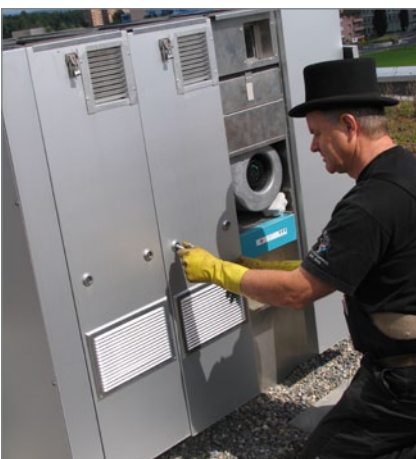
6. Öffnen der Revisionstüre