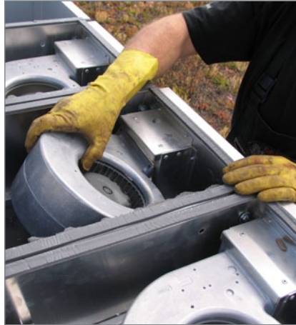
10. Netzstecker ausziehen und Ventilator entfernen