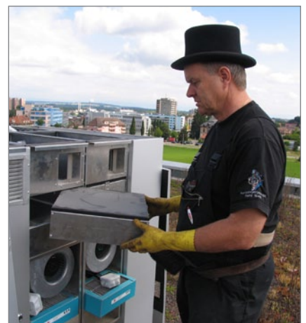
8. Entfernen der Schalldämpfer