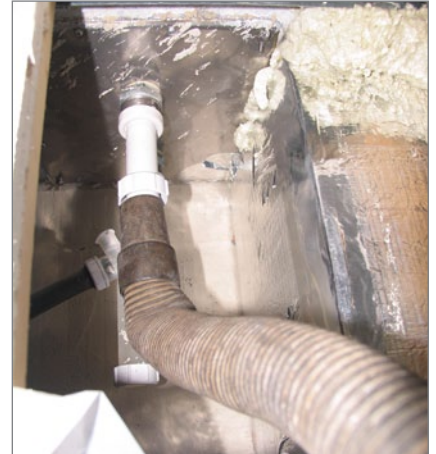
3. Wassersaugerschlauch montieren