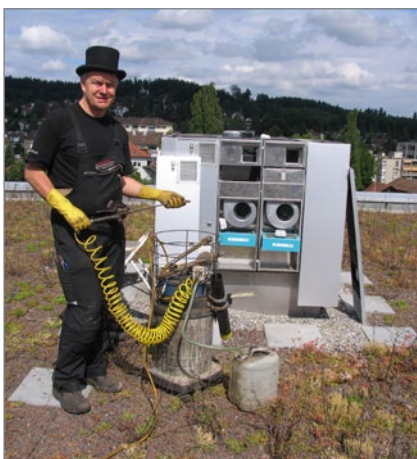
12. Alkalische Reinigung des Wärmetauschers mit geeigneten Reinigungsmittel