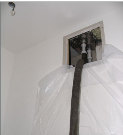
4. Der Wassersauger erzeugt Unterdruck im Lüftungsmodul