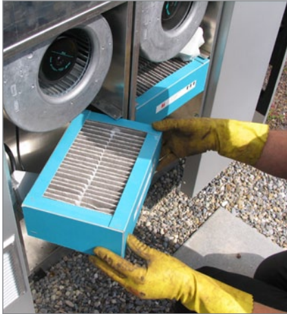
9. Ersetzen der Filter