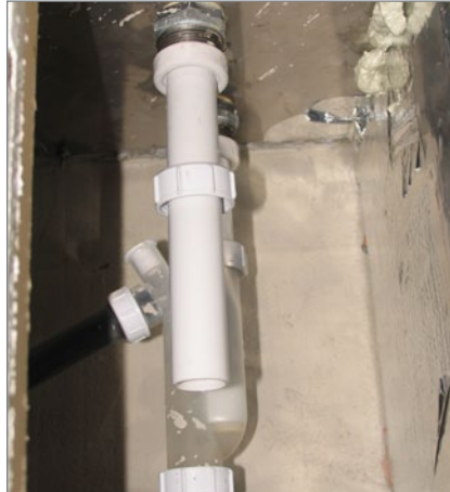
2. Ablauf ohne Sifon