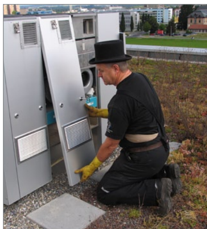
7. Entfernen der Revisionstüre